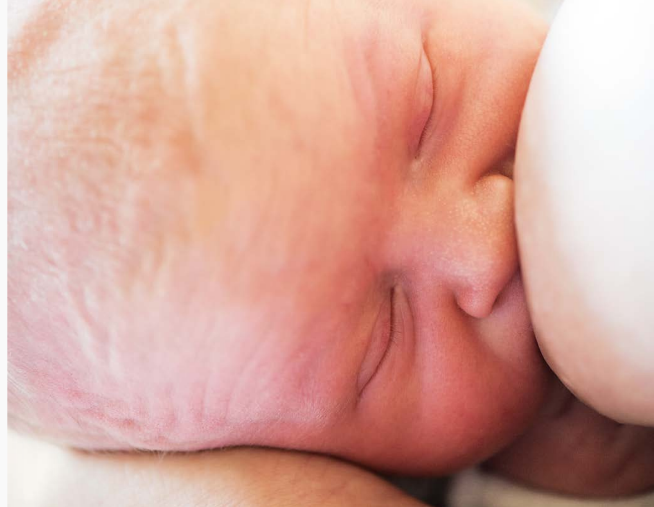
Ihr Baby bestimmt selbst, wann und wie viel es trinken will. Frühe Hungerzeichen wie Schmatzen und Suchen zeigen Ihnen, dass Ihr Kind trinken möchte.